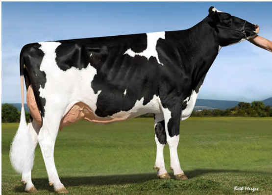
LADYS-MANOR KBOY SHALVA THIRD DAM