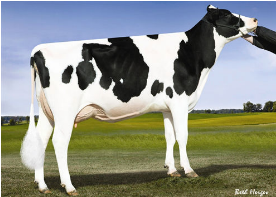
LADYS-MANOR M RUBYD SHAY FIFTH DAM